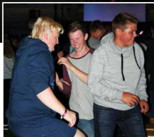
Full fart og full innsats «...danser inn i himmelen»