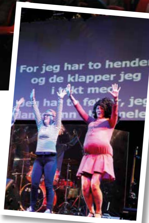
Kreativ framvisning av bevegelser til den populære sangen: To hender