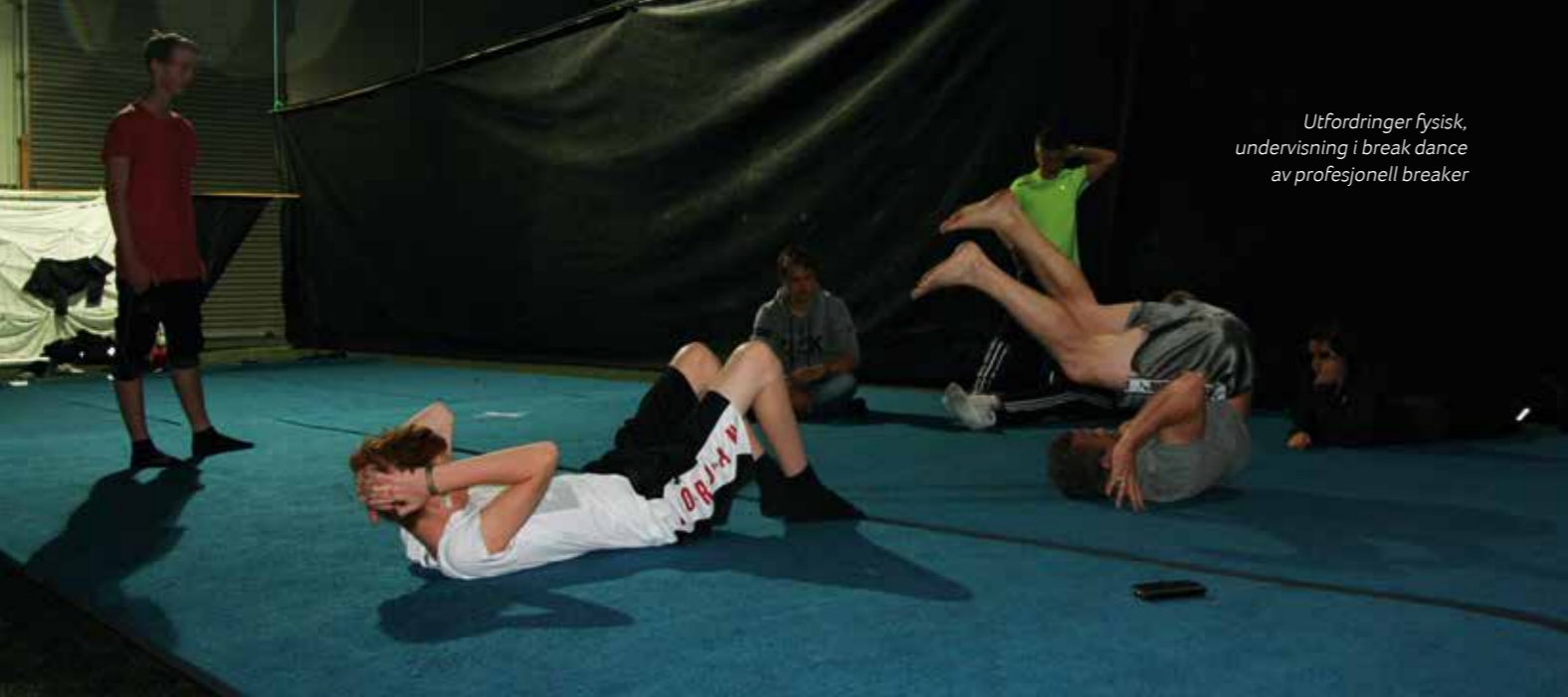
Utfordringer fysisk, undervisning i break dance av profesjonell breaker