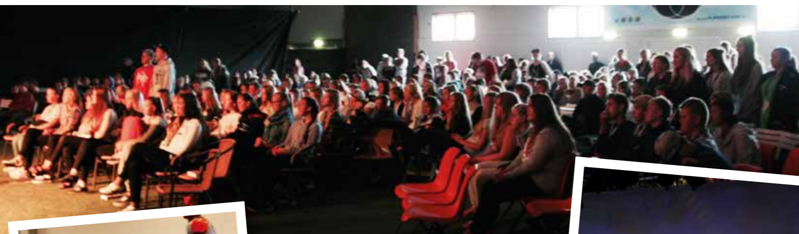
Konfirmantene satt som lys under møtene